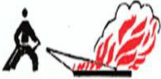
RÜZGARI ARKANA AL