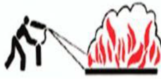
CİHAZI ALEVİN DİBİNE TUT