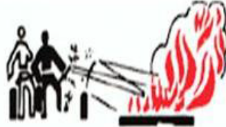
EVVELA ÖNÜ SONRA İLERİYİ SÖNDÜR